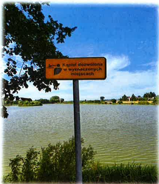
Fotografia nr 2. Widok na tablicę informacyjną przy Zalewie Łosickim