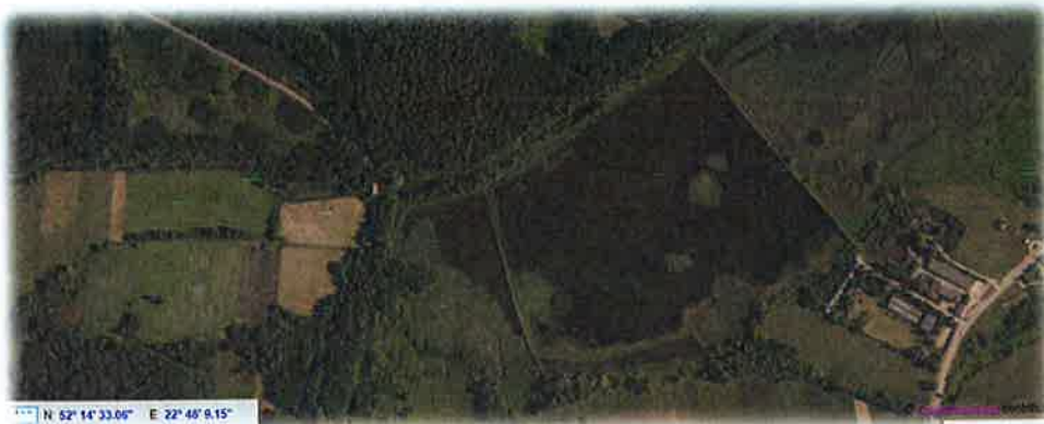
Fotografia nr 4. Widok stawów w miejscowości Woźniki

w Warszawie na działkach o nr ew. gruntów 393, 394, 396, 391 i 398 obręb Woźniki o powierzchni ok. 35 ha. Grunt znajdujący się pod stawami jest nieogrodzony, otoczony roślinnością szuwarową, porośnięty w części drzewami o nieregularnej linii brzegowej nie nadaje się do kąpielii przez mieszkańców i turystów.