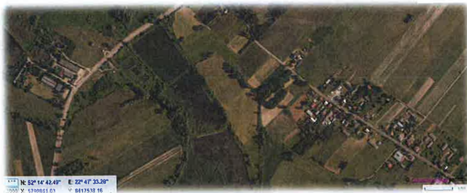
Fotografia nr 5. Widok stawów w miejscowości Woźniki (przy drodze krajowej nr 19)

3. Woźniki gm. Łosice – stawy stanowią własność Skarbu Państwa a wykonywanie prawa własności Skarbu Państwa przez Krajowy Ośrodek Wsparcia Rolnictwa Oddział Terenowy w Warszawie. Grunty pod stawami obejmują działki o nr ew. gruntów 426 i 430 obręb Woźniki o powierzchni ok. 4,8759 ha. Położenie stawów na nieruchomościach w części ogrodzonych, wyklucza możliwość kąpielii przez mieszkańców i turystów oraz służą do hodowli ryb.