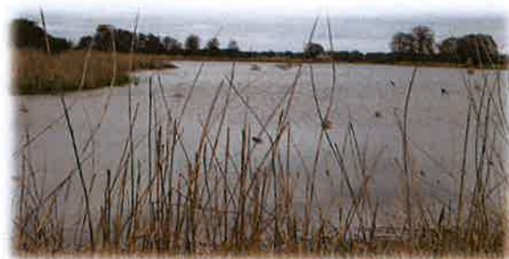
Fotografia nr 3. Widok stawów w miejscowości Rudnik