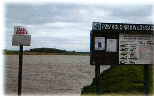
Fotografia nr 6. Widok stawu w miejscowości Stare Biernaty

Wody stojące (stawy) na terenie gminy Łosice nie nadają się do kąpieli. Zgodnie z art. 21 ust. 2 ustawy o bezpieczeństwie osób przebywających na obszarach wodnych nie ma zastosowania w przypadku osób fizycznych nie dysponujących nieckami basenowymi wyłącznie do celów prywatnych. Wskazane ww. wody (stawy) stanowią bowiem wyłącznie własność właściciela gruntu i są wykorzystywane do celów prywatnych.